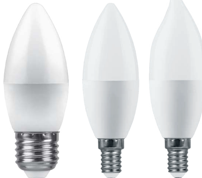
Арт. 38110, 38111, 38112