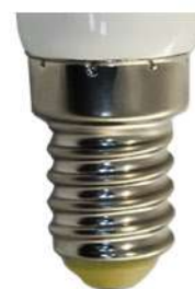
Цветовая температура: 2700K Артикул: 25516