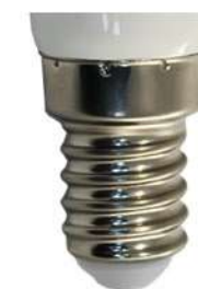
Цветовая температура: 6400K Артикул: 25518