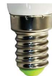
Цветовая температура: 4000K Артикул: 25517