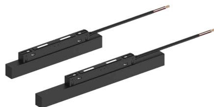
LB48 арт.41955/41956 (100/200W)

Трансформатор электронный (драйвер) LxWxH, мм (120/150x50x20)