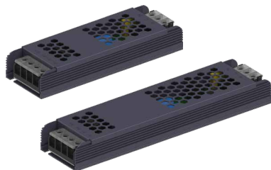
LB048 арт.41957/41958 (100/200W)

Трансформатор электронный (драйвер) LxWxH, мм (120/150x50x20)