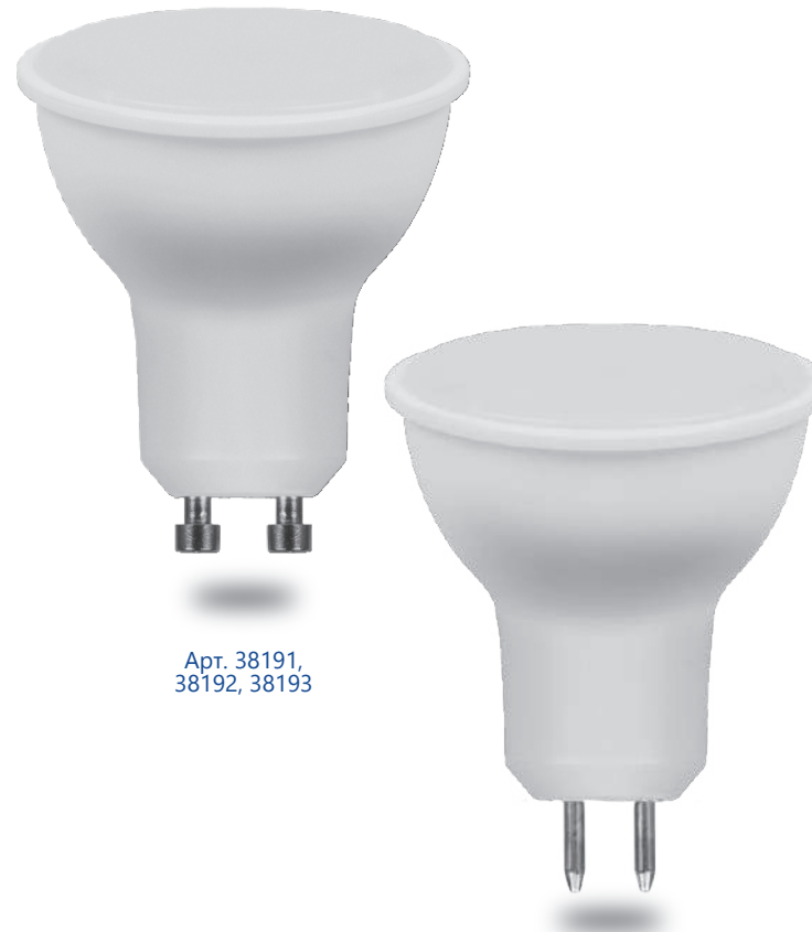
Арт. 38191, 38192, 38193