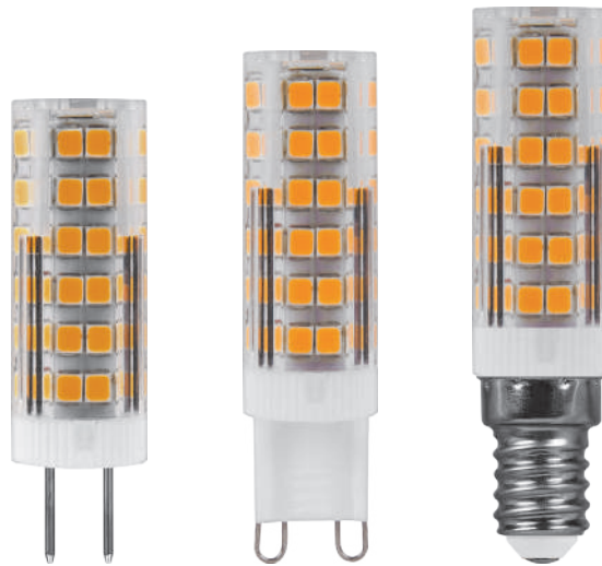
Арт. 25863, 25864, 25865