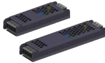
LB048 арт.41957/41958 (100/200W)

Трансформатор электронный (драйвер) LxWxH,мм (120/150x50x20)