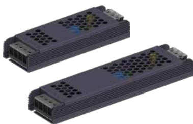
LB048 арт.41957/41958 (100/200W)

Трансформатор электронный (драйвер) LxWxH, mm (120/150x50x20)