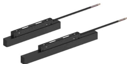
LB48 арт.41955/41956 (100/200W)

Трансформатор электронный (драйвер) LxWxH, mm (120/150x50x20)