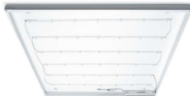
Линзы на светодиодах для равномерного освещения