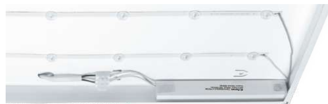
Расположение драйвера вне зоны видимости

AL2117 ТМ FERON – универсальная светодиодная панель с равномерным свечением.